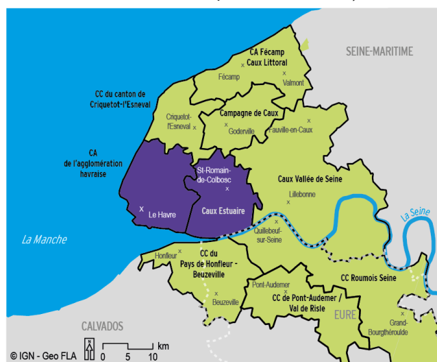
Nouveau territoire d'analyse du marché des entrepôts

Périmètre d'étude historique Périmètre d'analyse élargi Intercommunalités Départements